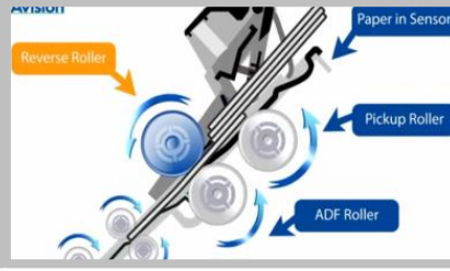
이중급지 방지 Reverse Roller